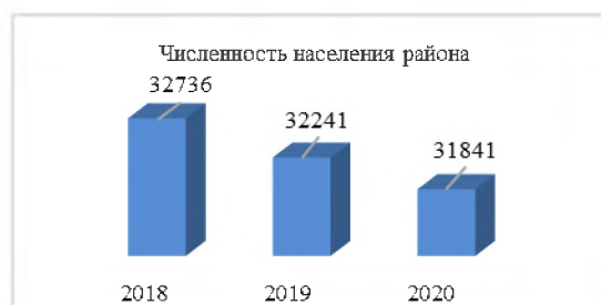
Рисунок 1 – Численность населения Чунского района, в чел.

Численность населения Чунского районного муниципального образования по состоянию на 01.01.2020 года составила 31841 человек, что на 400 человека меньше показателей прошлого года. По половой структуре населения преобладают женщины, удельный вес которых от общей численности населения составляет 52,5%. По возрастной структуре численность населения трудоспособного возраста составляет 16550 человек, это 52 % от общей численности.