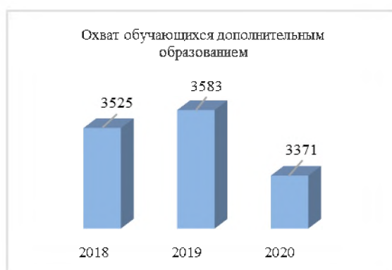
Рисунок 6 – Охват обучающихся дополнительным образованием, в чел.

В муниципальном этапе Всероссийской олимпиады школьников участвовали 684 обучающихся (в 2019 - 869 человека, в 2018 году - 882, уменьшение из-за распространения коронавирусной инфекции), из них 244 стали победителями и призёрами. Высокие результаты обучающиеся показали по предметам: русский язык, литература, английский язык, физическая культура, история, биология, ОБЖ, технология.