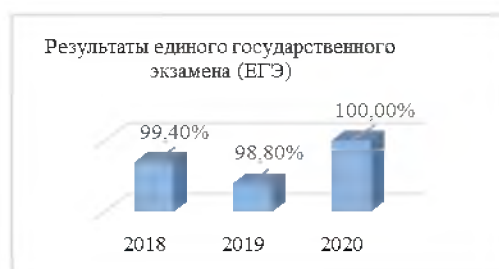
Рисунок 7 – Результаты ЕГЭ, в проц.

В 2020 году ГИА была проведена в форме промежуточной аттестации, по результатам которой документ об образовании получили 430 выпускников 9-х классов (из них 9 выпускников прошлых лет со справкой) и 172 выпускника 11-х классов (из них 2 выпускника прошлых лет со справкой).