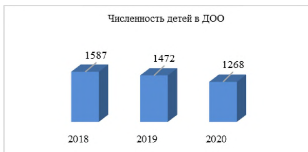
Рисунок 2 – Численность детей в дошкольных организациях, в чел.

Согласно информации о численности населения на 1 января, года следующего за отчетным, по годовой оценке возрастно-полового состава населения на основе переписи населения и текущего учета рождений, смерти и миграции населения, полученной от ОГБУЗ «Чунская районная больница», количество детей раннего возраста в Чунском районе в течение последних трех лет снижается примерно на 8 % ежегодно. Следовательно, в ближайшие 3-5 лет численность детей, обучающихся в дошкольных организациях, будет снижаться на 3-4 %.