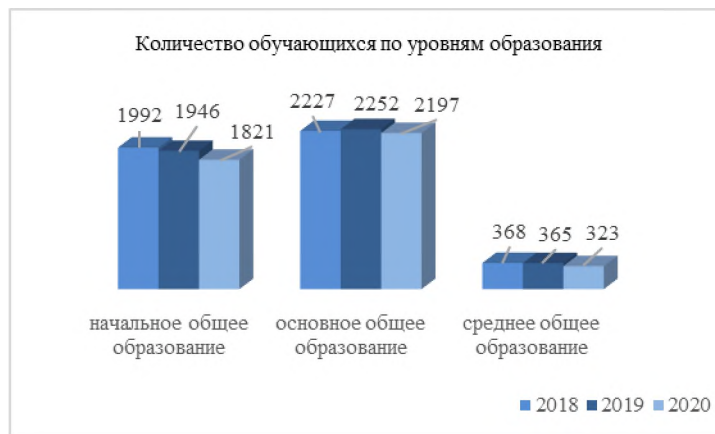
Рисунок 5 – Количество обучающихся по уровням образования, в чел.

Численность воспитанников школы - интерната № 11 р.п. Лесогорск - 63, в прошлом учебном году 62. Количество классов-комплектов - 9. Средняя наполняемость классов составляет 7 человек, отсутствуют обучающиеся в 1, 2, 3, 5, 6 общеобразовательных классах. В рамках перепрофилирования школы-интерната в специальную коррекционную школу, на базе учреждения открыты 3, 4, 5, 7, 8 классы для детей с легкой умственной отсталостью, в которых обучаются 45 детей из населенных пунктов Чунский, Лесогорск, Бидога, Октябрьский, Веселый.