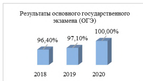
Рисунок 8 – Количество обучающихся, получивших аттестат, в проц.

Экзамены в 9-х классах были отменены, а единый государственный экзамен (далее - ЕГЭ) сдавали выпускники 11-х классов, планирующие поступление в высшие учебные заведения.