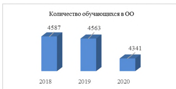
Рисунок 3 – Количество обучающихся в образовательных организациях, в чел.

На начало 2020-2021 учебного года в муниципальных общеобразовательных организациях Чунского района обучался 4341 ребенок (в 2019 году - 4563), уменьшение на 222 человека. В течение 3-х лет наблюдается уменьшение учеников в ОО.